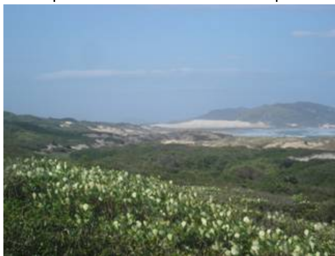
Vegetação de restinga e dunas do Campeche. Data 27/10/08.

Em seguida, farão a postura da “árvore que balança”, permanecendo na postura da montanha, de olhos fechados, balançando o corpo levemente, em forma de espiral, para os dois lados, sentindo os pés, como as raízes de uma grande árvore da Mata Atlântica. Depois, soprarão como faz vento na vegetação. Esta prática possibilitará uma melhor assimilação do conteúdo explanado, como também com que os alunos sintam-se como parte integrante da natureza.