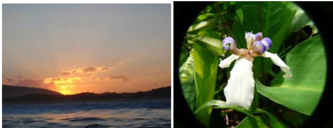
Paisagem da orla do Campeche e espécies da flora nativa da Mata Atlântica. Data: set/08.e 15/10/08

Neste contexto, o professor fará questionamentos para os alunos, em relação a outros meios de degradação ambiental, que afetam a localidade; funções naturais características do bioma da Mata Atlântica, como da vegetação de restinga, fixadora de dunas e de solos recentes: e da importância da preservação deste ecossistema para a qualidade de vida da população local.